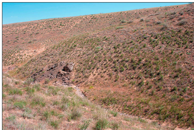
е / е

Рис. 2. Пустынные ландшафты Юго-восточного Казахстана: a – возвышенность Жельтау, горы Шагырлы, 27.04.2011 г.; б – Восточные Мойынкумы, северная часть, 25.04.2011 г.; в – Восточные Мойынкумы, южная часть, 23.04.2011 г.; г – пустыня Таукум, 30.04.2011 г.; д – пустыня Сарыесик-Атырау, 1.05.2011 г.; е – низкогорье Куланбасы, 4.05.2011 г.