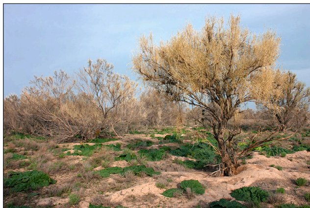
б / б