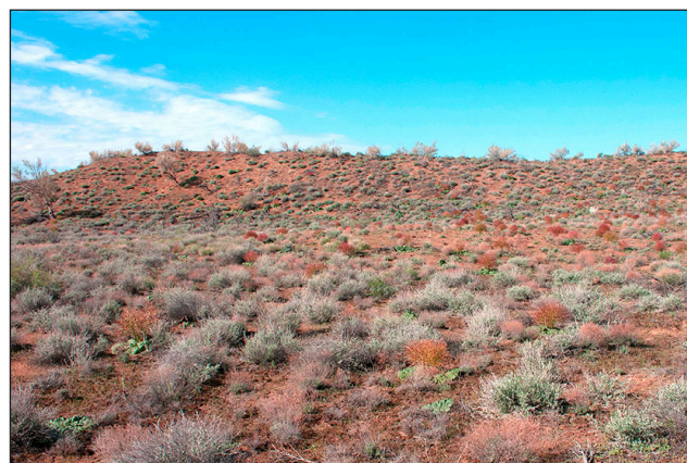
г / г