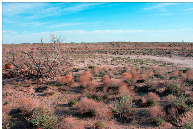
д / д