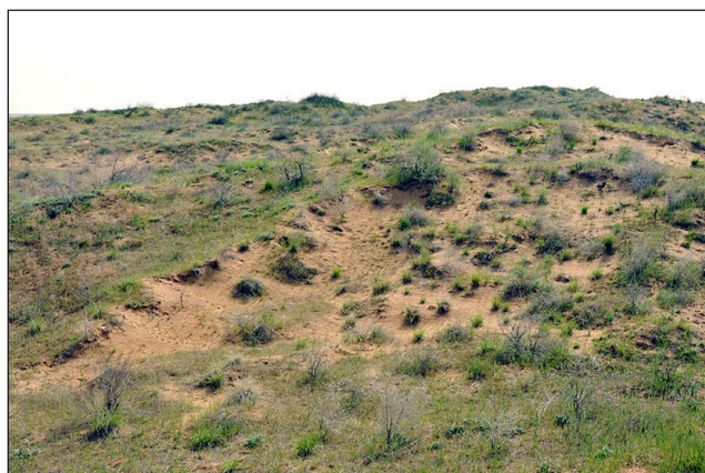
в / в