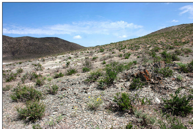
a / a